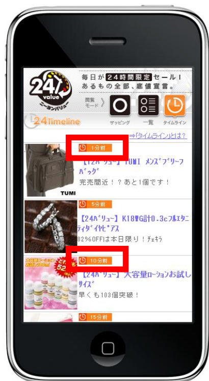
24 (ニーヨン) タイムライン 時系列で新着情報や販売個数を表示。