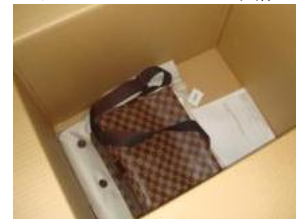
ダンボールのスキマ事情

その第一弾として、ブランドディアのユーザーは約30代～40代女性が約50%を占め、小学生を子どもに持つ母親世代(※)であることから、(財)ジョイセフの「ランドセル」を通じた妊産婦保健の向上を目指す活動に賛同いたしました。これにより、(財)ジョイセフによる活動の認知度向上と普及を促すだけでなく、「身近な不用品が誰かの必需