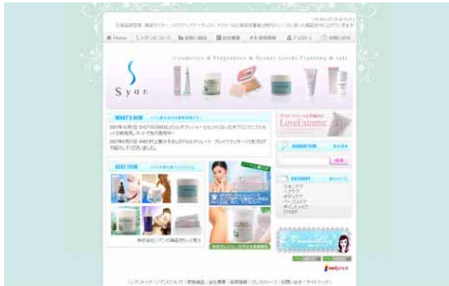
株式会社シアン ホームページ (www.syan.co.jp)